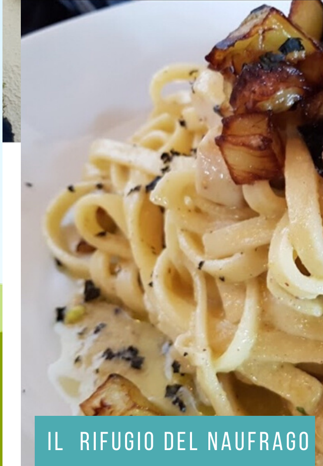
IL RIFUGIO DEL NAUFRAGO